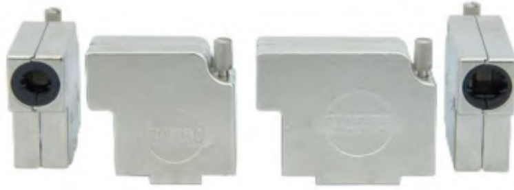
Metal hood FMBR in shell sizes 1 and 2. Metallhaube FMBR in der Gehäusegröße 1 und 2.